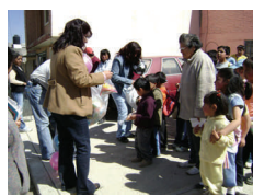
Entrega de dulces, gelatinas y juguetes por el Día de Reyes

Constituye el objeto de la Asociación la promoción de la participación organizada de la población y de lo socios en la realización de actos o decisiones en las acciones identificadas como del Estado para satisfacer un rango de necesidades que el mercado no satisface o no puede satisfacer para sectores numéricamente importantes de la población, es por ello que la Asociación busca mejorar la distribución de activos como alimentación, educación, salud, trabajo, vivienda digna, etc., a favor de los grupos vulnerables y sectores de la población más desfavorecidos, que les permitan mejorar sus propias condiciones de subsistencia y bienestar bajo un ambiente de equidad de género en donde se evite la discriminación y se promueva la equidad.